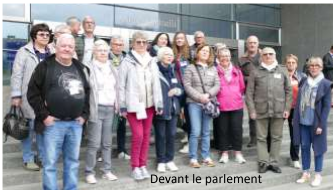
Devant le parlement

Cette réussite en appelle une autre. Tous travaillent désormais à la préparation du 40ème anniversaire du jumelage, qui aura lieu en 2024 à Roye.