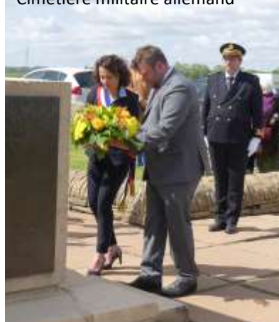
Cimetière militaire allemand

Beaucoup d'implication pour cette première cérémonie de la journée du bien-vivre ensemble en paix. MM. Say, sous-préfet, M. Zychlinski, Maire du Wedemark, les enfants des écoles royennes ont contribué à la réussite de cette nouvelle journée.