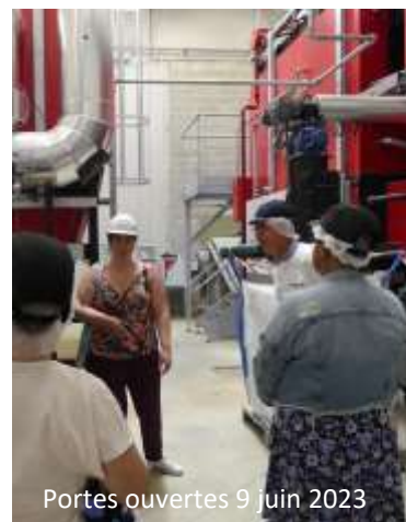
Portes ouvertes 9 juin 2023

Fontaine » et le foyer alsacien. Le centre hospitalier, le Conseil Départemental (Maison des Solidarités et de l'Insertion) et la résidence AMSOM (Ancien hôpital) ont également choisi le raccordement.