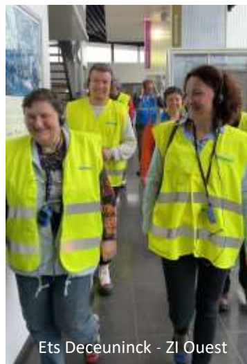
Ets Deceuninck - ZI Ouest

Nous réfléchissons à la deuxième édition !