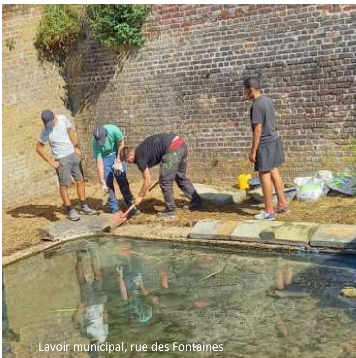
Lavoir municipal, rue des Fontaines

Outre le projet participatif, à savoir la réfection du lavoir, ce qui les motive et les réunit reste cet échange entre jeunes de toutes nationalités. Un moment qui marque.