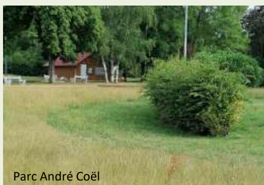
Parc André Coëll