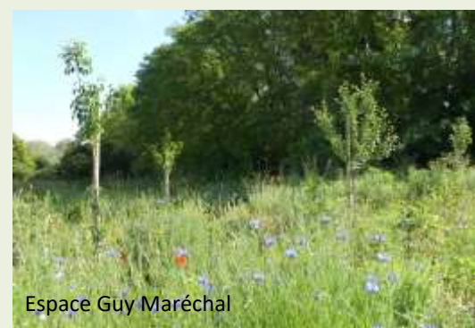
Espace Guy Maréchal