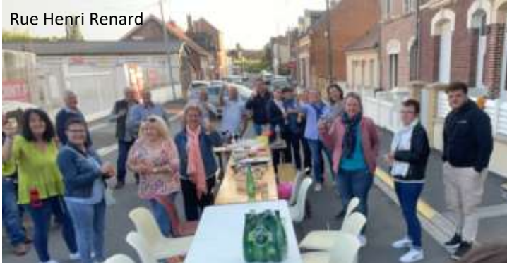
Rue Henri Renard

Retour sur les nouveaux rendez-vous que vous ont proposé vos élus ces dernières semaines.