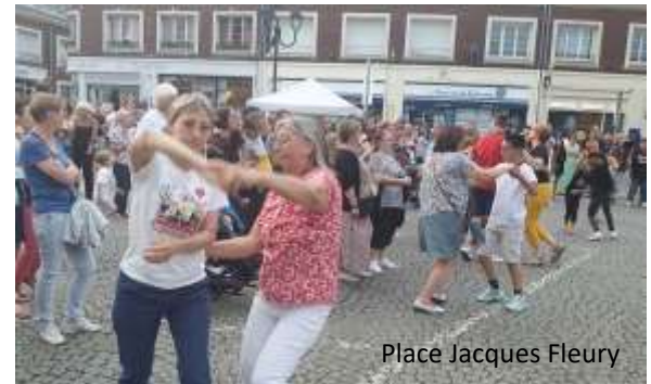
Place Jacques Fleury