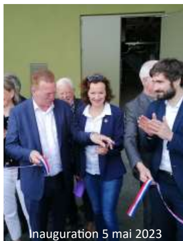
Inauguration 5 mai 2023

Quatre abonnés sont actuellement desservis. La Ville de Roye tout d'abord avec le raccordement de plusieurs bâtiments parmi lesquels la mairie, l'école « Les Tilleuls » et l'école « Yvette et René