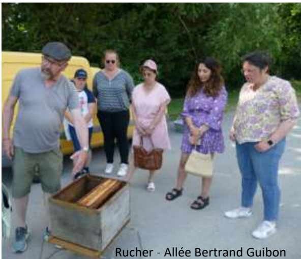
Rucher - Allée Bertrand Guibon

Nous avons chanté, nous avons dansé... Quelle soirée superbe !